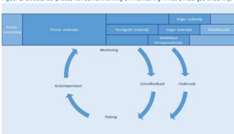
Figuur 2: Structureel proces van samenwerking en monitoring in het Limburgse onderwijs

De primaire doelstelling van de EAL is het bevorderen van de dialoog en samenwerking tussen alle partijen die betrokken zijn bij het onderwijs in Limburg, om zo het onderwijs verder te verbeteren en te zorgen voor een efficiënte aansluiting van dat onderwijs op de Limburgse arbeidsmarkt. De betrokken partijen zijn de scholen, schoolbesturen en kennisinstellingen in Limburg, maar ook andere partijen die een rol spelen, zoals het bedrijfsleven, de GGD, de gemeenten, de Provincie Limburg, en andere instellingen. Door een structurele dialoog en samenwerking wordt de beschikbare kennis en – vaak complementaire– expertise van de verschillende spelers in het onderwijsveld optimaal benut en omgezet in concrete initiatieven waarmee wordt nagegaan wat wel en wat niet werkt als onderwijsverbetering. Dit gebeurt op een continue, cyclische manier (figuur 2) waarbij ook steeds de juiste gegevens worden verzameld die nodig zijn om projecten te evalueren en het benodigde beeld te krijgen hoe het onderwijs ervoor staat. Belangrijk is overigens dat de dialoog op verschillende niveaus plaatsvindt, niet enkel op bestuursniveau. Het doordringen tot de verschillende lagen binnen het onderwijs is geen eenvoudige opgave en vereist een intensieve fase van verkenning van elkaars wereld en het leren spreken van elkaars taal. Deze verkenning vindt momenteel plaats en uit zich al in enkele concrete samenwerkingsverbanden.