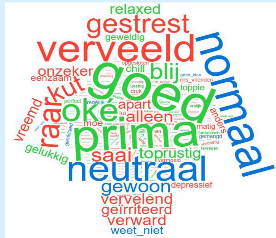
Figuur 2. Hoe voelt leerling in 3vo zich in één woord?